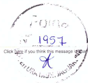
image001.png (5,5 K) C-016-PMJ - CP Nº 02_2021.pdf (193,1 K)

Click here if you think this message is spam.