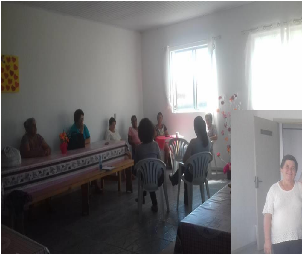
Grupo de Mães PAIF