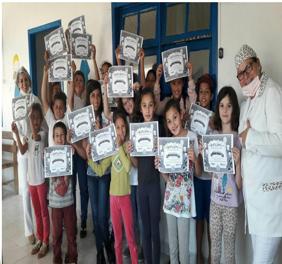
Cuidando da Saúde Bucal