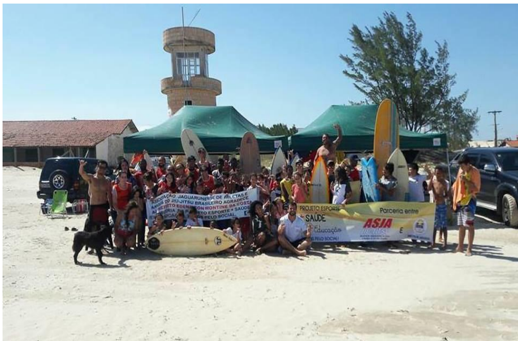
Aula de Surf