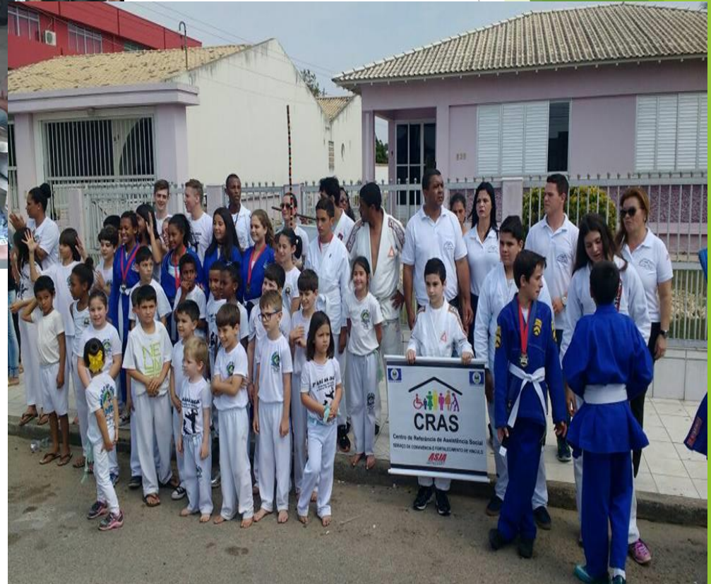
Desfile 07 de Setembro