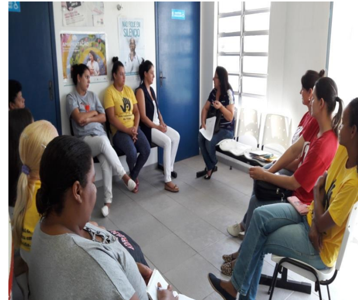
CONSELHO LOCAL DE SAÚDE