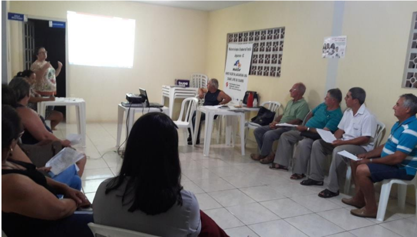
CONSELHO MUNICIPAL DE SAÚDE