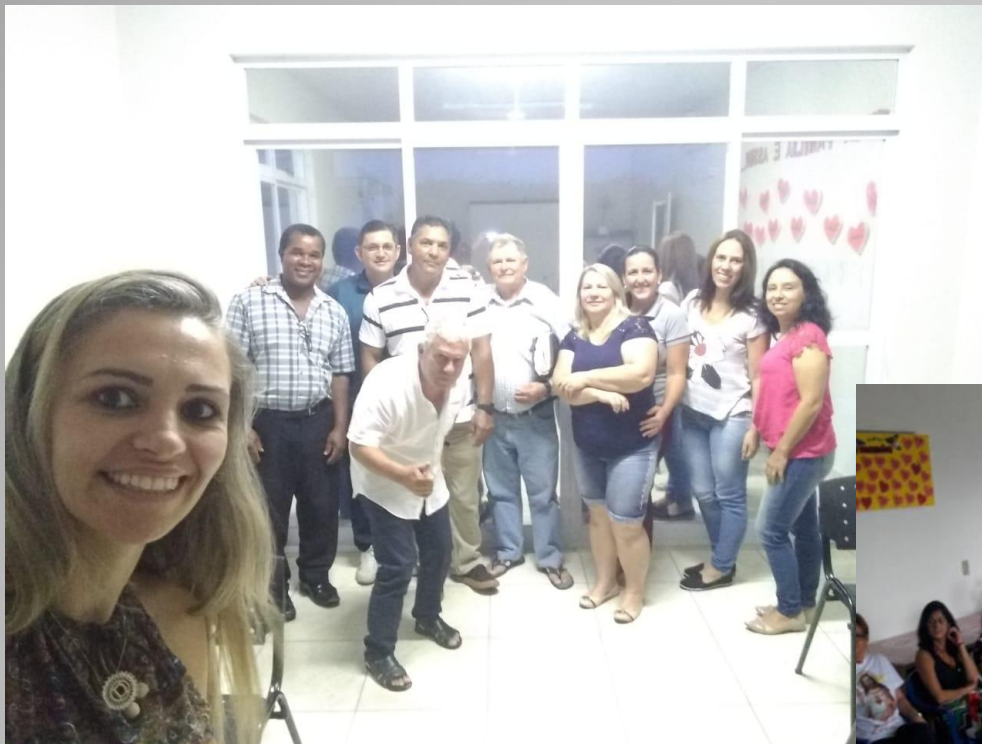
CONSELHO MUNICIPAL DE SAÚDE