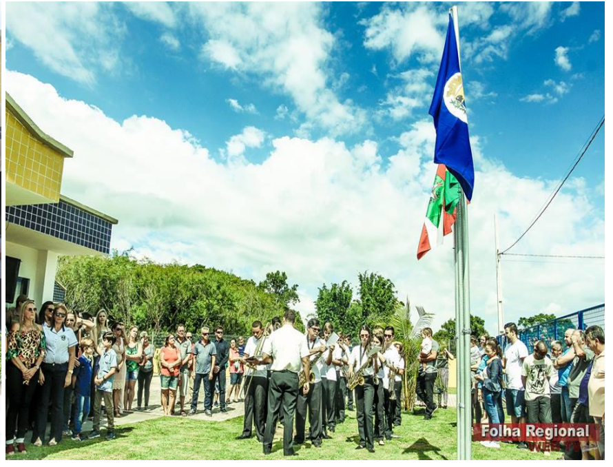
Folha Regional WEB TV