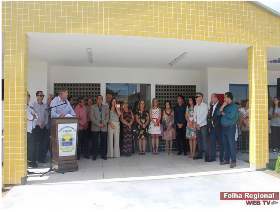
Folha Regional WEB TV