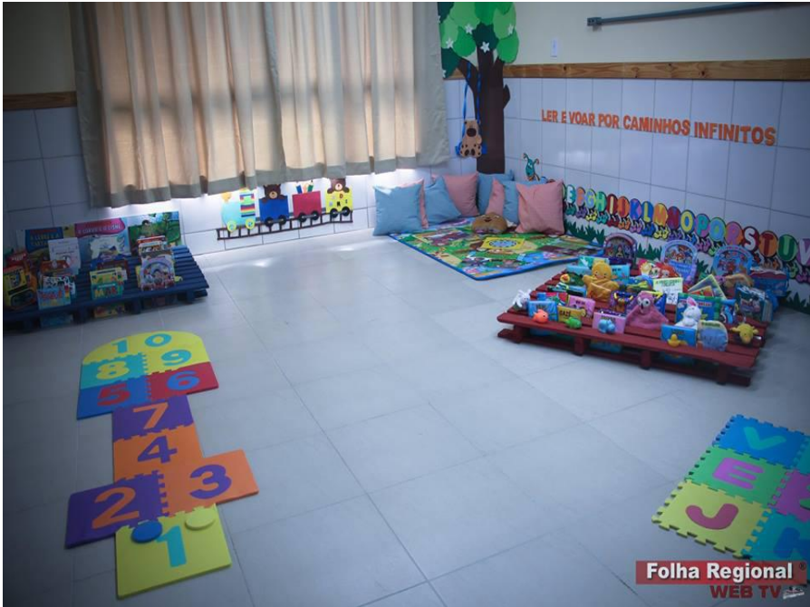
Folha Regional WEB TV