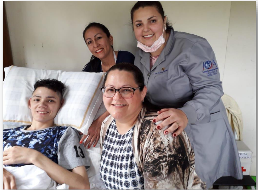
FOTO AUTORIZADA PELO PACIENTE